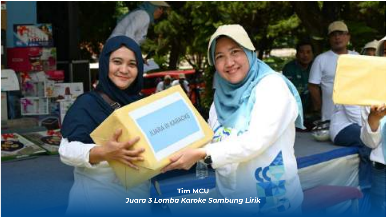
Tim MCU Juara 3 Lomba Karaoke Sambung Lirik

“Kami akan terus berbenah melakukan transformasi di semua fungsi dan menjadikan Rumah Sakit Krakatau Medika sebagai Pusat Rujukan Rumah Sakit di wilayah Banten dan Lampung. Pada kesempatan yang baik ini saya atas nama manajemen menyampaikan penghargaan yang setinggi-tingginya dan terima kasih